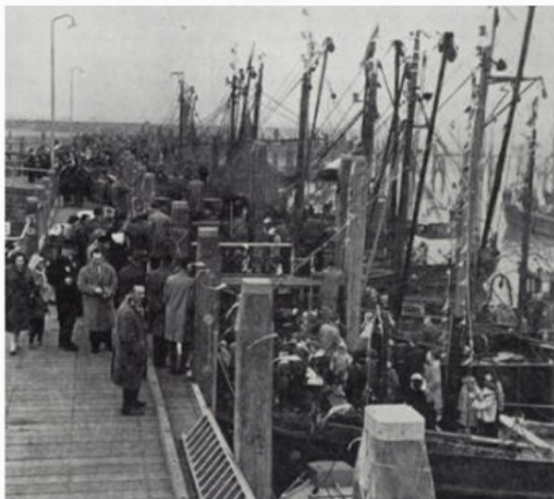
Aankomst veerse vissers in de nieuwe thuishaven Colijnsplaat 1961.

Bent u zelf nog in het bezit van historisch materiaal over de Vissershaven van Colijnsplaat of wellicht ander historisch materiaal over ons dorp? Stel dit dan a.u.b. ter beschikking aan deze stichting, bijvoorbeeld door het materiaal te doneren of door het in te laten scannen! Kijk voor de Contactgegevens .