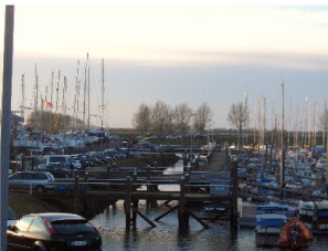
biedt op de schepen.

Het is van groot belang alle gezichtsbepalende elementen in Colijnsplaat met zorg in stand te houden. De haven en de houten kades maken daar nadrukkelijk deel van uit en bepalen het karakter van de haven als geheel. Het heeft charme en geeft een kenmerkend beeld aan de inrichting. Het dorp moet hier zuinig op zijn. Andere havenplaatsen zoals Zierikzee, Veere, Goes en Vlissingen hebben ook hun eigenheid en karakter. Hier in Colijnsplaat zijn het de houten steigers.